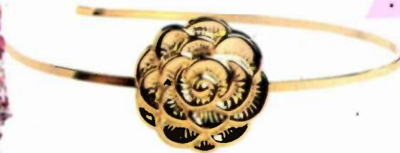
"אבגד", שקל 35