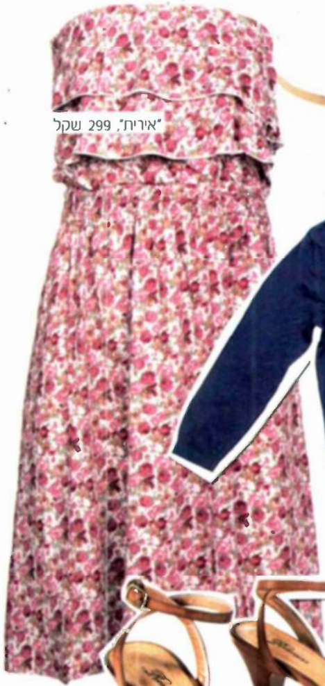
"אירית", שקל 299