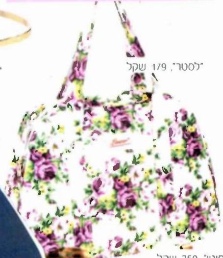
"לסטר", שקל 179