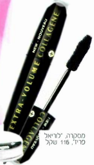
מסקרה, "לוריאל פריז", שקל 116