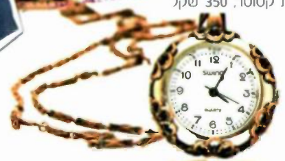
"אפרת קוטו", שקל 350