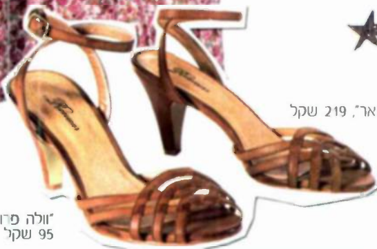
"רנואר", שקל 219