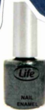
"Life", שקל 19.99