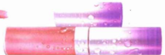
ליפגלוס, "מיילין", שקל 79.99