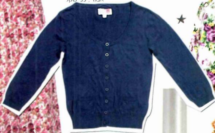
"פוקס", שקל 119.99