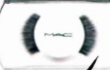
"M.A.C", שקל 67